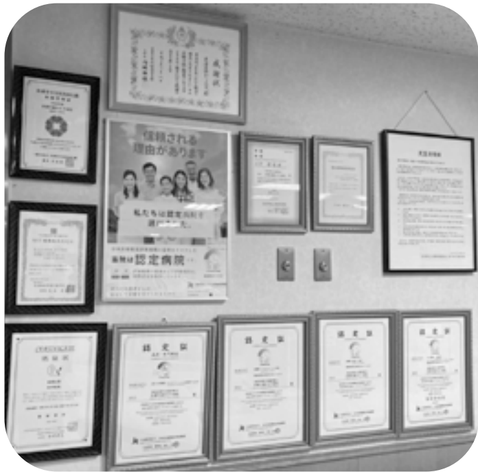
認定証は、わたり病院正面玄関に飾られています。

病院医療機能評価とは、日本医療機能評価機構が病院組織の運営管理や医療の質を中立的に評価し、継続的な改善活動を支援する外部評価制度です。 当院では2025年12月、一般病院1、副機能(緩和ケア病院・リハビリテーション病院)、および高度・専門機能(リハビリテーション・回復期)の4区分