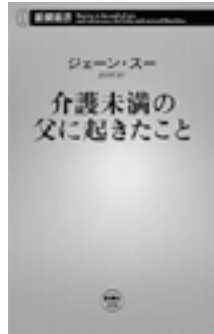
介護未満の父に起きたこと 新潮新書刊 [ ジェーン・スー ]

「老人以上、介護未満」で生活力ゼロの父親を、ビジネスライクに対処していく様子を描いた著書です。なるほどと感心する対処方法と、「父のケアは『終わらないフジロックフェスティバル』とウィットに富んだ表現が満載で、さくさく読み進められます。自分の親のため、将来の自分のため、それぞれの立場で読んでも得られるものがあり、二家に二冊置いておきたい本です。