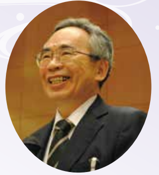
ありし日の丹治先生