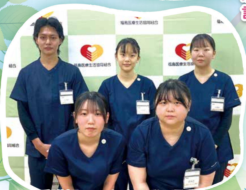
看護師のみなさん

わたしたちの事業所に17名の 新入職員を迎えました。 一人でも多くの方の力になれ るよう日々がんばっていきます。 どうぞよろしくお願いします。