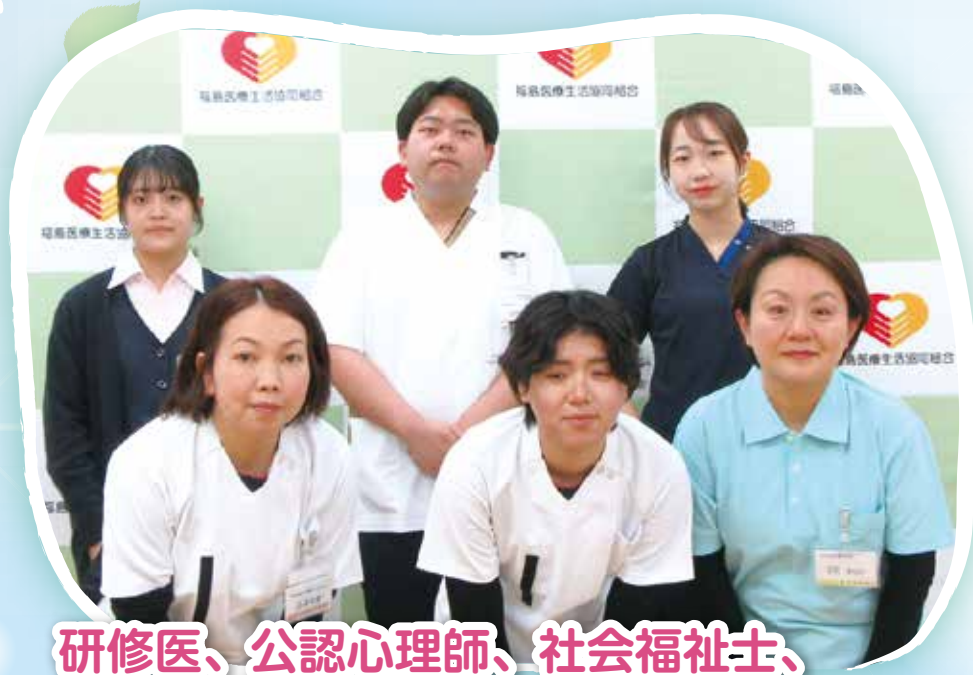
研修医、公認心理師、社会福祉士、 介護支援専門員、事務職のみなさん

福島医療生活協同組合 TEL 024-522-1236 〒960-8141 福島市渡利字中江町66 医療生協わたり病院 TEL 024-521-2056 〒960-8141 福島市渡利字中江町34 生協いの診療所 TEL 024-562-4120 〒960-1301 福島市飯野町字後川27-2 医療生協わたり病院附属 ふれあいクリニックさくらみず TEL 024-559-2664 〒960-0241 福島市笹谷字塗谷地20-1