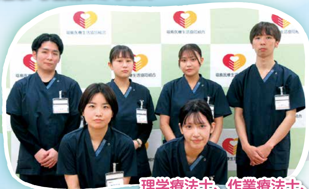
理学療法士、作業療法士、 言語聴覚士のみなさん