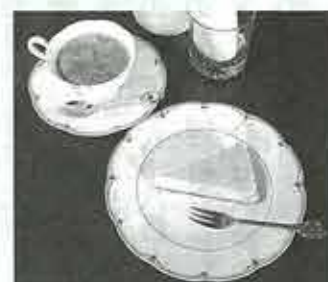
この日のケーキはマロンと濃厚なチーズのケーキでした

「木いちご」という名前に聞き覚えのある方も多いのではないのでしょうか。ティールーム木いちごの店主は、北ブロックの「うたごえサークル木いちご」で