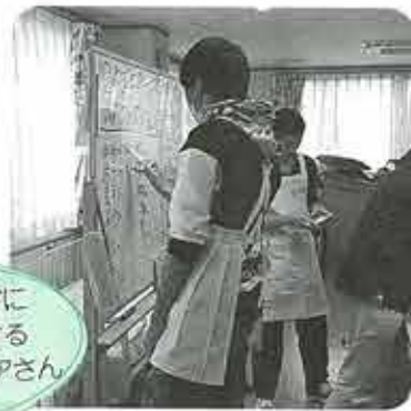
ホワイトボードに点数を記入する学生ボランティアさん

んが生懸命コップの底を見て、赤い文字が書いてあったらカゴに入れ、青い文字のものは元に戻します。