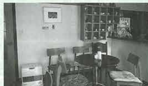
暖かみのある店内はお客様同士の距離も縮めてくれます