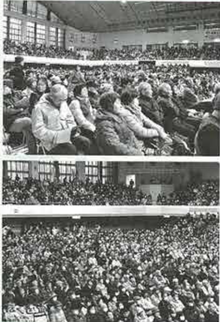
二階席は県外からの参加者です。椅子が足りなくなるほどの参加者が集まりました。

故に伴う被害への賠償、および被災者の生活再建支援を国と東京電力の責任において完全に実施する」ことなどを改めて訴えました。福島医療生協からは組合員八十人職員二十人が集会に参加し、青いゼッケンと原発反対のグッズを持って、自分たちの想いを訴えました。