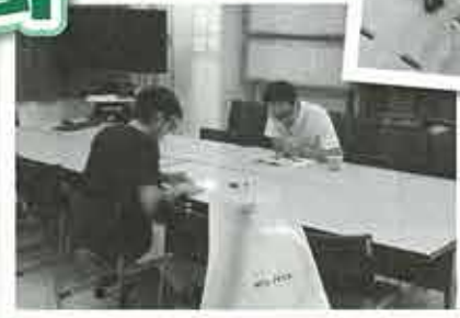
▲早朝に行われる指導担当の医師との抄 読会（英語で書かれた症例の論文を読む）