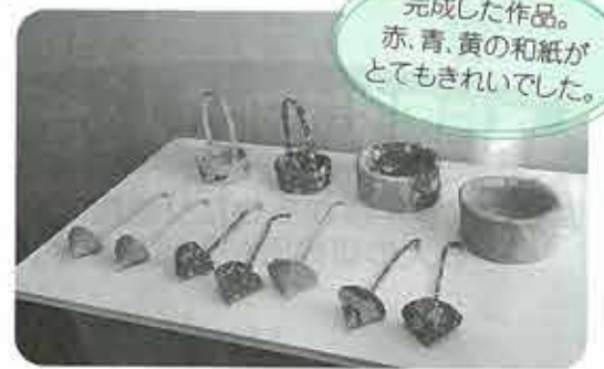
完成した作品。赤、青、黄の和紙がとてもきれいでした。