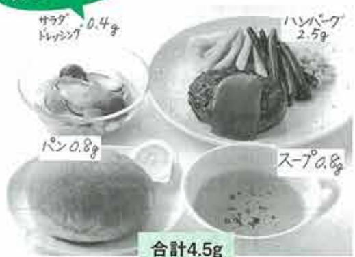
群羊社 そのまんま料理カードより