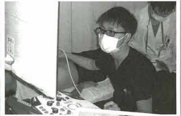
▲エコーの練習中 真剣なまなざしで 画面を見つめて操 作をしています