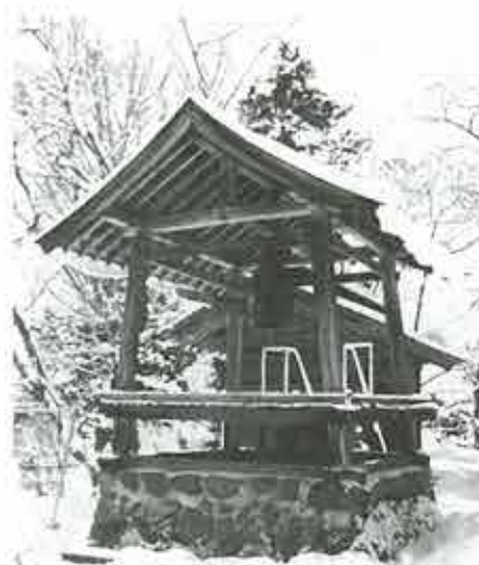
雪の日の観音寺鐘楼と梵鐘

信達地方では享保から寛延のころまで凶作の年が続き、頼みの桑も霜にやられて大損。百姓は年貢の五割減、未納分は翌年までの延期、代官所手代の土屋恵助の罷免を要求した。寛延二(一七四九)年十二月十日早朝、伊達勢、信夫勢の百姓二万六千八百人が、鐘の音を合図に桑折代官所をとりかこむ。その時の合図の鐘が桑折町大字万正寺