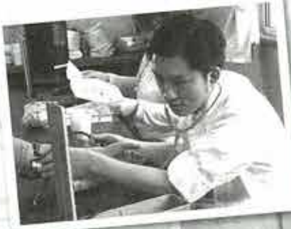
◀仮設のお茶会にも 参加しました 仮設入居者の方 の血圧を測って います

福島医療生活協同組合 TEL 024-522-1236 F 960-8141 福島市渡利字中江町66番地 医療生協わたり病院 TEL 024-521-2056 F 960-8141 福島市渡利字中江町34番地 生協いいの診療所 TEL 024-562-4120 F 960-1301 福島市飯野町字後川27-2 医療生協わたり病院附属 ふくまいのクリニックさくらさき TEL 024-559-2664 F 960-0241 福島市笹谷字釜谷地20-1