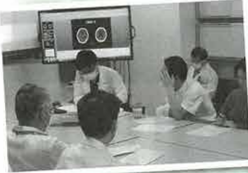
▲症例検討会の様子