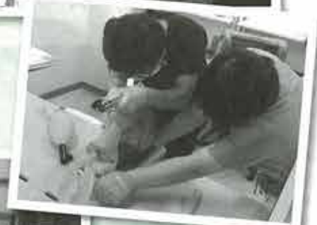
▲シミュレーターを使用 して気管挿管（気管 に気管内チューブを 挿入して気道を確保 する）の練習を行っ ています