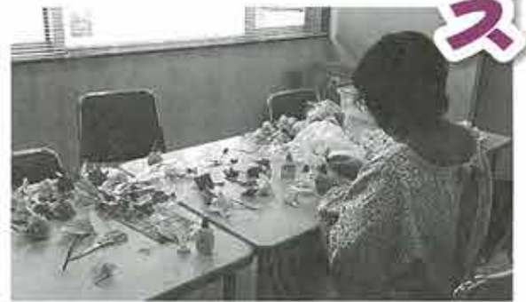
2、3か月に一度はお弁当に折り紙をつけて配ります。