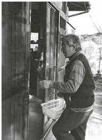
「こんにちは、お変わりありませんか？」お弁当を届けながら一軒一軒声をかけて地域をまわります。

「ふれあいの会」が発足したのは平成十四年四月。平成十二年に町内で一人暮らしをしていた高齢者の孤独死を契機に、町と住民が各種団体事業所に呼び掛け発足しました。平成二十一年の市町村合併に伴い一度は解散しましたが、地区住民の強い要望をうけ、平成二十二年に再発足し現在に至ります。