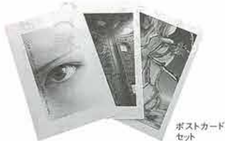
ポストカードセット

では、娘さんが描いた絵の「絵はがき」(三枚セット三百円)を普及しながら入会と募金の支援を訴えています。