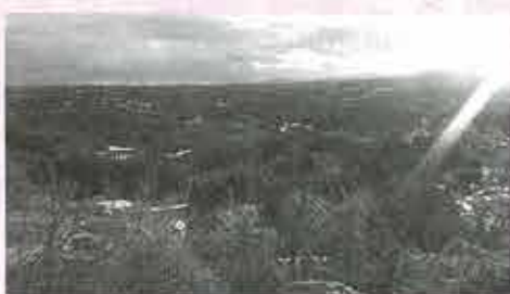
千貫森から望む飯野の町並み

この他にも介護保険サービスでは対応できない問題がたくさんあります。飯野町では地域の中でこれらの問題を「自分たちでどうにかしよう」という取り組みが始まりました。包括ケアの研修会にも包括、開業医、民生委員、医療生協とNPOが参加し顔の見える関係をつくり盛り上がっています。