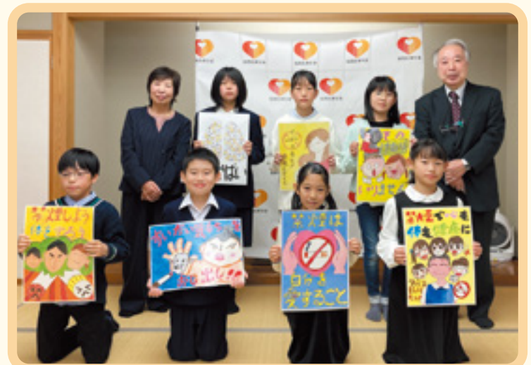
禁煙ポスターコンクール表彰状伝達式