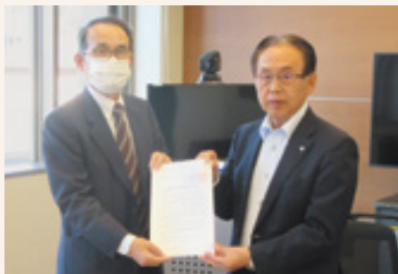
川俣町町長に要望書をお渡ししました

高齢者も生きがいを持って、社会から孤立せず輝いて生きていく権利があります。これからも、みなさんの意見を聞いて、要望が実現されるように活動を続けていきます。