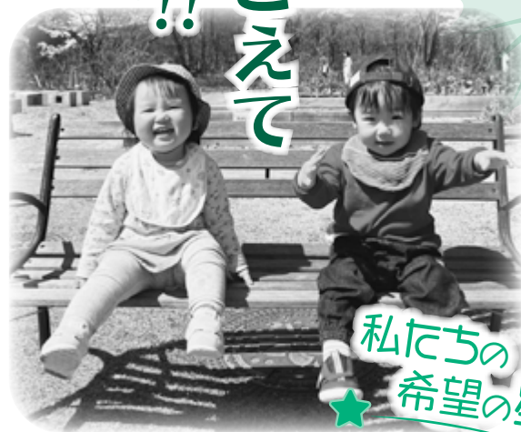
私たちの希望の星