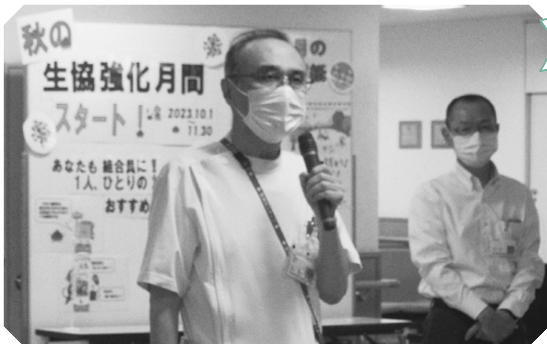
10月3日 わたり病院外来フロアにて

福島医療生活協同組合 TEL 024-522-1236 〒960-8141 福島市渡利字中江町66 医療生協わたり病院 TEL 024-521-2056 〒960-8141 福島市渡利字中江町34 生協いいの診療所 TEL 024-562-4120 〒960-1301 福島市飯野町字後川27-2 医療生協わたり病院附属 ふれあいクリニックさくらみず TEL 024-559-2664 〒960-0241 福島市笹谷字塗谷地20-1