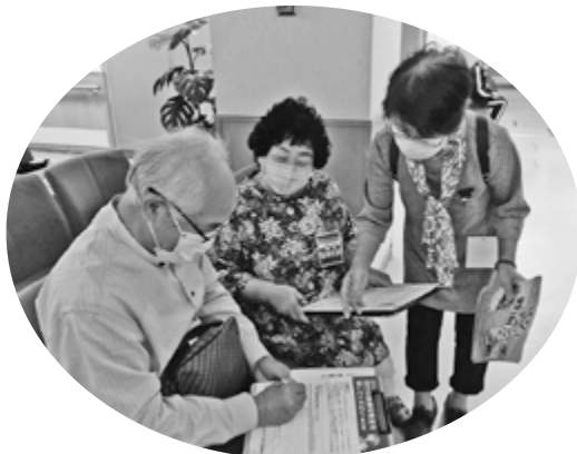
“現行の健康保険証を残してください”の請願署名をお願いしました。