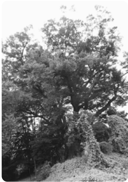
(住所) 福島市飯坂町平野字古館42)

※ 平野地区青少年健全育成推進会発行40周年誌「平和の伝承とくらし」から引用、一部編集を加えました。