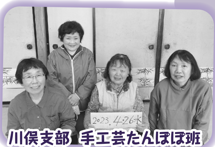
川俣支部 手工芸たんぽぽ班