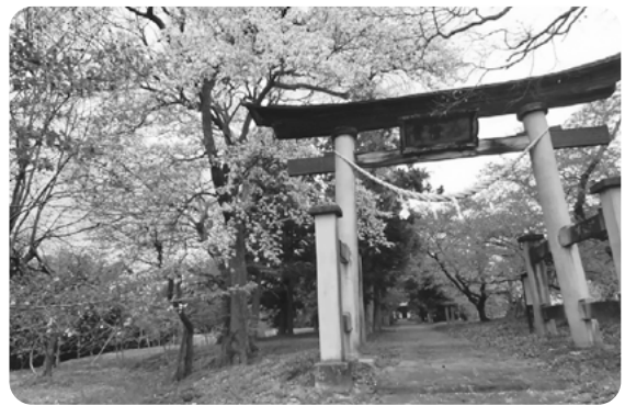
(所在 / 伊達市梁川町八幡堂庭11)

樹高はおおよそ20メートル、幹回りは1.9メートルにも及ぶ。私たちが普段口にする果樹園の梨ではなく、梨のもともとの原種とのことと神社宮司からも伺った。鳥居をくぐると拝殿まで続く長い石畳み、中世にタイムスリップしたような佇まいを感じた。