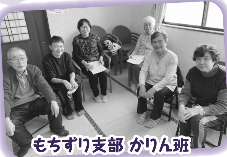
もちずり支部 かりん班