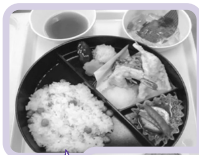
6月行事食 あじさい膳

また、各病棟には管理栄養士を配置し、栄養状態の改善を目指し入院中のみならず心と身体の栄養を満たしたいと日々奮闘中です。医師の指示のもと、入院中や外来通院中の患者さん