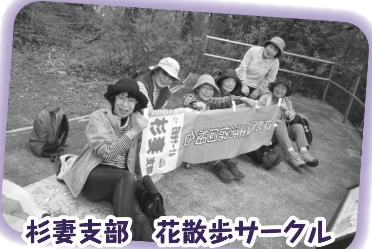
杉妻支部 花散歩サークル