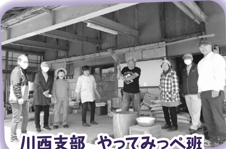
川西支部 やってみっぺ班