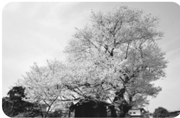
所在 福島市宮代字北口17

陣屋の敷地にある桜の木は、今も数百年の風雪に耐え、見事に咲き誇ります。また市の天然記念物に指定された大カヤの木もあり、いずれも見事な老木です。