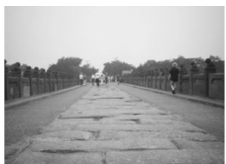
盧溝橋: 1192年に完成した長さ300m弱の石橋。マルコポーロの「東方見聞録」にも記載されている。

私が、この盧溝橋という大きな橋を渡りながら、同行していた大曲市の教育委員S氏にトクトクとこの戦争の発端を語った。すると氏いわく「その人は私の隣村の