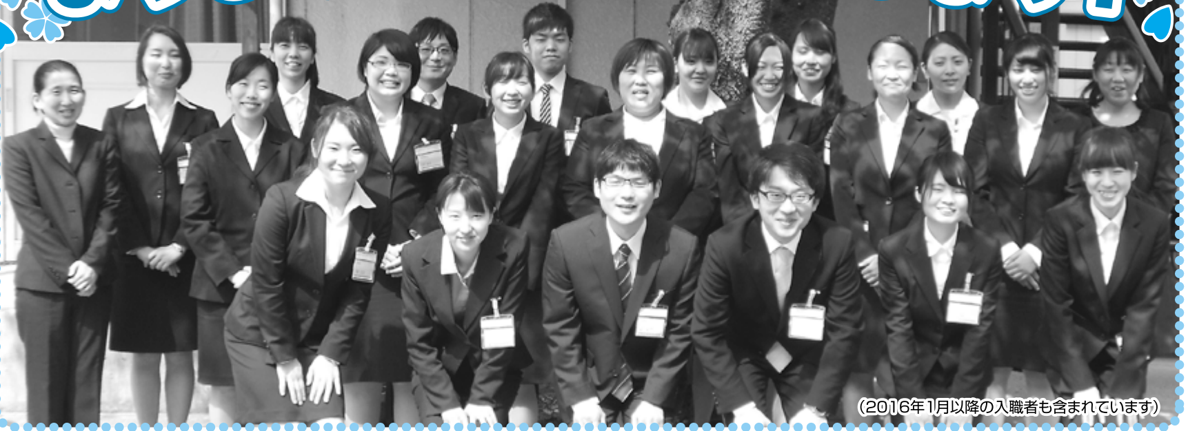
(2016年1月以降の入職者も含まれています)