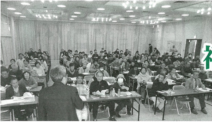
「震災・原発事故三周年集会」には150名の組合員・職員が参加しました。