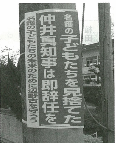
名護市内の電柱に貼られたポスター

お申込み・お問合せ：医療生協わたり病院 健診センター Tel.024-522-3446