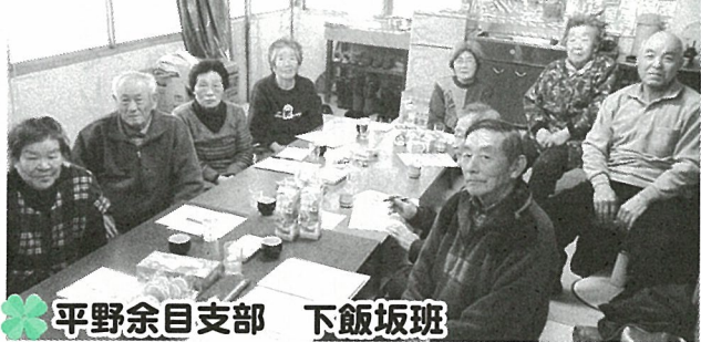
平野余目支部 下飯坂班

5月~6月は班づくり班会開催月間です 身近な友人と健康づくりを進めましょう 休眠中の班は班会を開きましょう