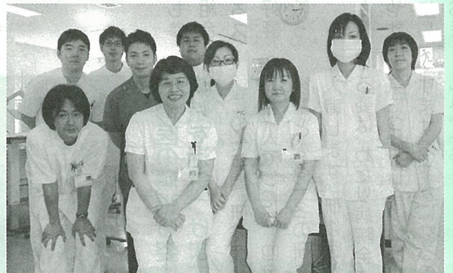
患者さんが安心して受けられる治療を提供します

で受けていただいていた方が、四時間〜五時間と長い時間治療をうけなければならず、一日おきの治療を休むことができません。私たちスタッフは、安全に治療が受けられるように時間を過さず、最近スタッフ三名が産休育休中ですが、全日本民医連から技師と看護