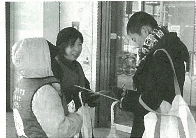
街頭での署名行動では市民からも「原発はなくてほしい」の声が多数寄せられました

しかし、政府はエネルギー基本計画のなかで、原発を「重要なベースロード電源」と位置づけました。これはわかりにくい表現ですが、今までどおり原発再稼働を進めるという意味で