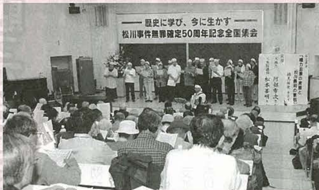
松川事件無罪確定50周年記念全国集会開のようす

に開かれ、初日には八百名を超す方々が全国から参加しました。「無実のものを死刑にするな」と思想信条や社会的立場をこえた公正裁判要求や被告救援の運動が全国に広がり、裁判では事件発生十四年後の一九六三年九月、被告二十名全員の無罪(一審は四名の死刑を含む全員有罪)が確定しました。