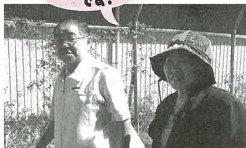
地域訪問のようす(杉妻支部)

員が患者さんへ加入をすすめる声かけをしています。患者さんに組合員になつていただくことは、患者のいのちを守り地域の要求にこたえる事業所づくりを進めることにつながります。病棟再編(回復期リハビリ病棟増床、緩和ケア病棟開設)後の医療活