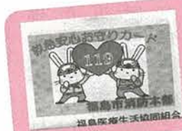
救急医療情報カード

なお、救急医療情報に関する問い合わせを直接消防署にしないでください。医療生協本部でまとめて行うことになっていきます。