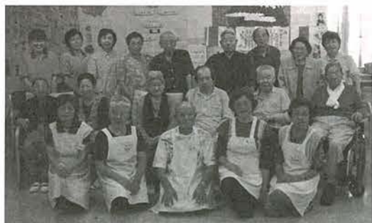
ひとみの会のみなさん(前列)と利用者、職員のみなさん

慰労金を支給されました。また、バザーを開き、皆さんからの寄附や生協からの援助金で活動費や交通費に充当することができました。私たちも学習会や施設見学、研修旅行と楽しい絆ができました。毎朝のお茶出しから、リハビリ体操、手作り作業のお手伝い、皆さんの喜ぶ笑顔に癒されて充実した日々を送らせていただきました。