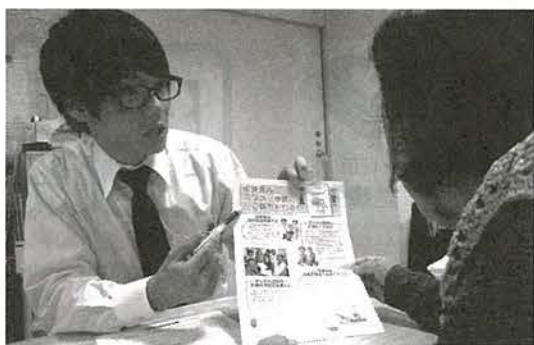
医療生協の事業や加入について説明する職員。病院でも加入・増資をすることができます。

十月から十二月までわたり病院の外来患者さんを対象に、組合員が医療生協の魅力や病院の特徴をお知らせし、加入や増資の呼びかけを行っています。病院を利用する上での困りごとや要望などもうかがっています。