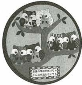
仮設住宅集会所に手作りの壁掛けがあり、「原発事故が無ければこんな生活しなくても」と思いが書かれてありました