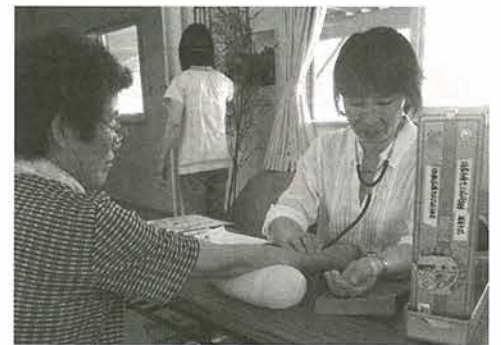
仮設住宅でのお茶会では、参加するみなさまの血圧と体重の測定や健康体操を行い、健康相談も行っております。

考えれば、3・11と原発事故により福島県民は、場所・職業・家族構成やその補償内容などにより、ひとりひとりの問題意識も含まれます。地域との関係はどうか？と率直にお伺いしました。