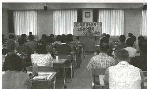
生協強化月間スタート集会(9/13)

日本のこれからは少子高齢化へ向かつてはいますが、高齢者が生き生きと暮らし、子どもたちが将来に希望の持てるような町づくりへ私たちが貢献して行きたいと思ひます。