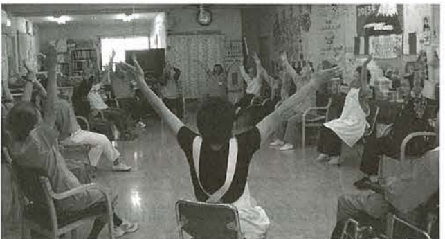
通所リハビリセンターでの体操のようす

お申込み お申し込みは福島医療生協 組織部で承っております。 TEL.024-522-1236