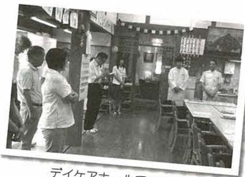
デイケアホールでの朝会

患者さんの希望に心じて、いいの診療所が在宅診療の紹介を受けたり、入院をお願いしたりするのは、主にはわたり病院です。そのわたり