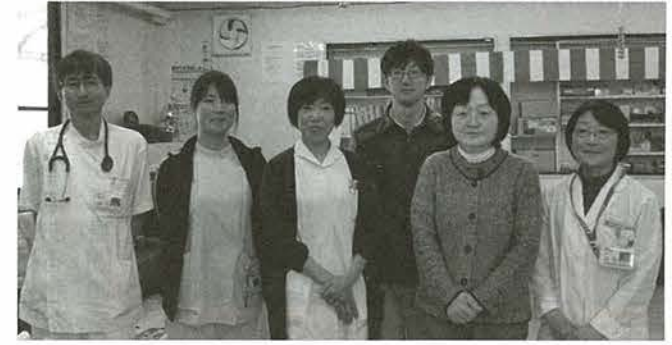
糖尿病診療科のスタッフのみなさん

います。これはインスリン分泌低下やインスリン抵抗性(インスリンの効きが悪い状態)をきたす素因を含