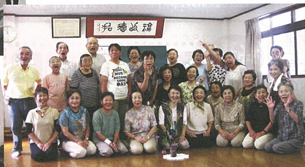
◀2011.9.8 清水北支部 ほっこの集い