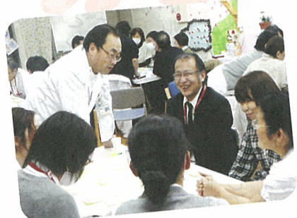
▲2011.2.3 医師・職責者による長期計画 ワークショップ