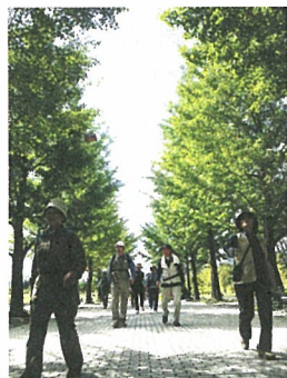
▲2011.10.4 WHO健康 ウォーク